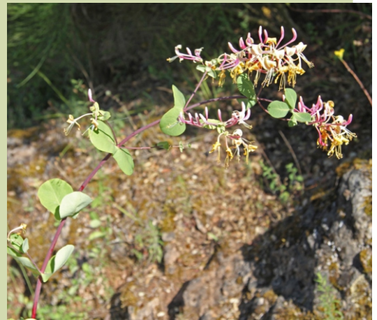
Lonicera etrusca. Especie de chuchamel de clima mediterráneo que só se atopa no surleste de Ourense.