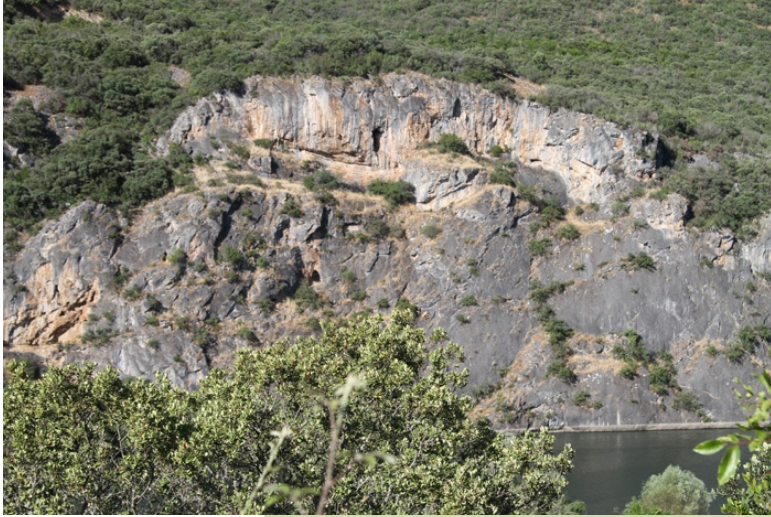
Cantís calcáreos sobre o Sil