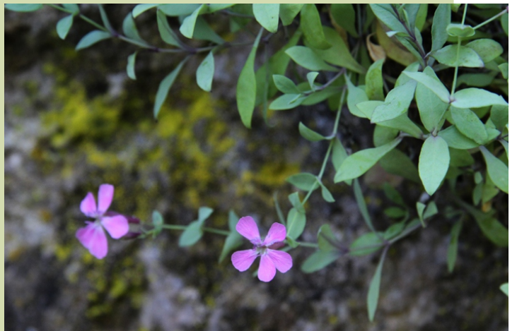
Petrocoptis grandiflora , un endemismo exclusivo da serra de Enciña da Lastra.