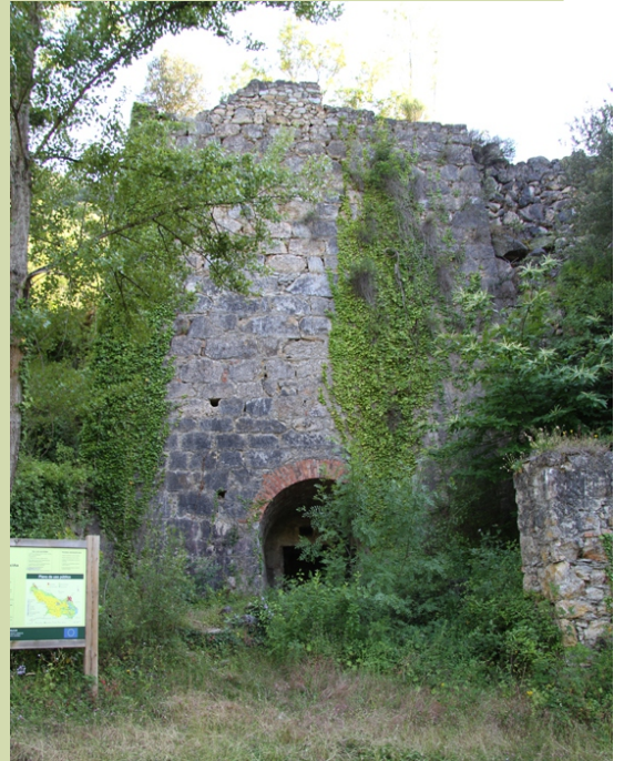
Forno de cal