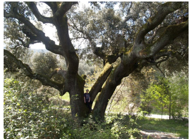
Aciñeira de Cobas (Rubiá-Ourense).

É a máis grande e máis antiga de Galicia, con preto de 400 anos. Mide 17,50 m de alto e 6 m de perímetro. Segundo unha lenda local debaixo da pedra que está na base do toro hai enterrado un tesouro do tempo dos mouros. Atópase na entrada de Covas á esquerda da estrada.