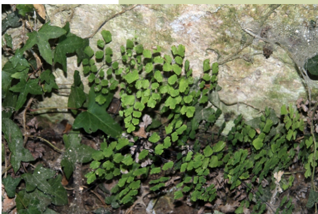
Adiantum capillus-veneris , un fento que só aparece moi disperso e raramente, que tamén se cultiva como ornamental.