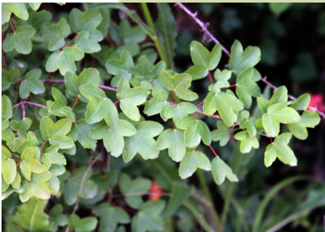
Arce de Montpellier ( Acer monspessulanum ). Árbore de pequeno porte que ten en Enciña da Lastra a única localización en Galicia.